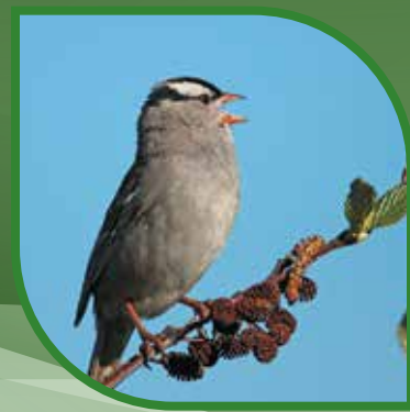
♀ Bruant à couronne blanche White-crowned Sparrow Zonotrichia leucophrys