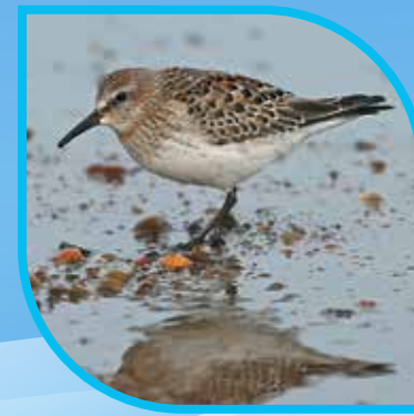
♀ Bécasseau à croupion blanc White-rumped Sandpiper Calidris fuscicollis