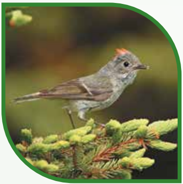
♂ Roitelet à couronne rubis Ruby-crowned Kinglet Regulus calendula