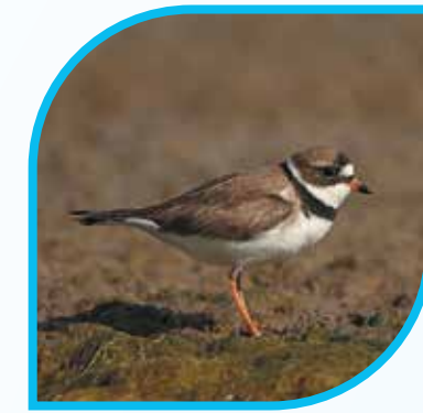
♀ Pluvier semipalmé Semipalmated Plover Charadrius semipalmatus