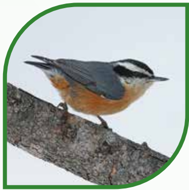
♂ Sittelle à poitrine rousse Red-breasted Nuthatch Sitta canadensis