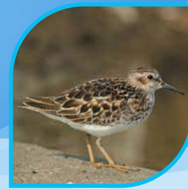
♀ Bécasseau minuscule Least Sandpiper Calidris minutilla