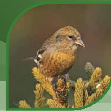
♀ Bec-croisé bifascié White-winged Crossbill Loxia leucoptera