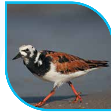
♀ Tournepierre à collier Ruddy Turnstone Arenaria interpres