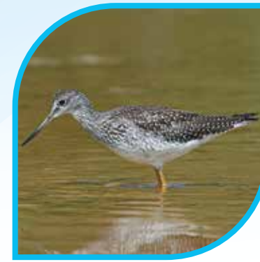
♀ Grand Chevalier Greater Yellowlegs Tringa melanoleuca