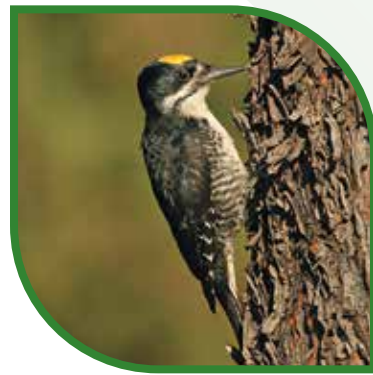
♂ Pic à dos noir Black-backed Woodpecker Picoides arcticus