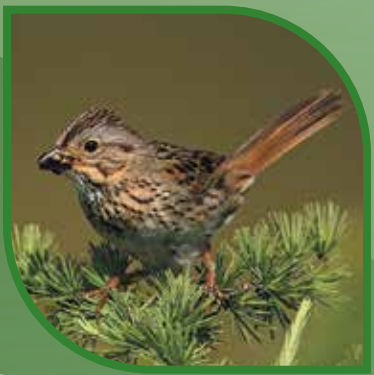
♀ Bruant de Lincoln Lincoln's Sparrow Melospiza lincolnii