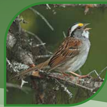
♀ Bruant à gorge blanche White-throated Sparrow Zonotrichia albicollis