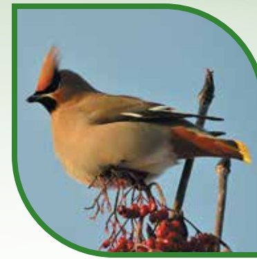
♀ Jaseur boréal Bohemian Waxwing Bombcilla garrulus