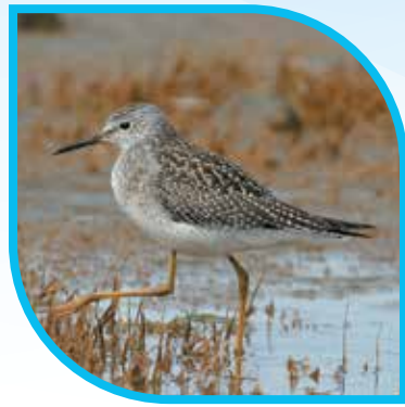
♀ Petit Chevalier Lesser Yellowlegs Tringa flavipes