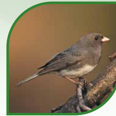
♀ Junco ardoisé Dark-eyed Junco Junco hyemalis