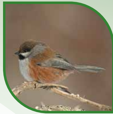
♀ Mésange à tête brune Boreal Chickadee Poecile hudsonicus