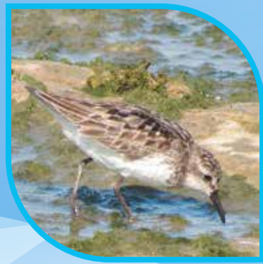
♀ Bécasseau semipalmé Semipalmated Sandpiper Calidris pusilla