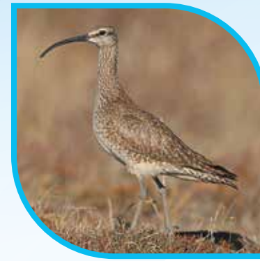
♀ Courlis corlieu Whimbrel Numenius phaeopus