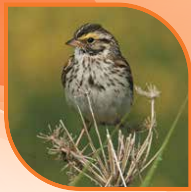
♀ Bruant des prés Savannah Sparrow Passerculus sandwichensis