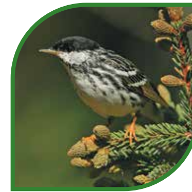
♂ Paruline rayée Blackpoll Warbler Setophaga striata