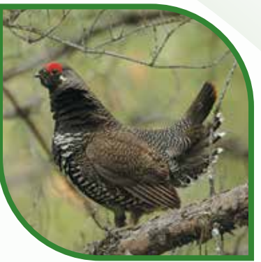
♂ Tétràs du Canada Spruce Grouse Falciptennis canadensis