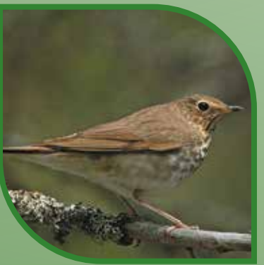
♀ Grive à dos olive Swainson's Thrush Catharus ustulatus