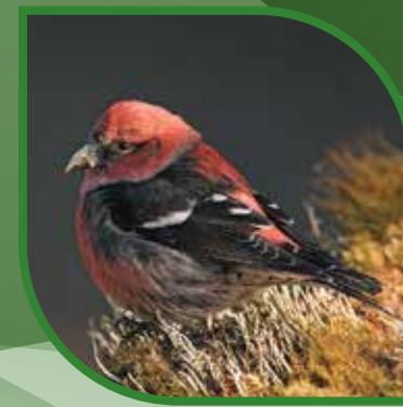
♂ Bec-croisé bifascié White-winged Crossbill Loxia leucoptera