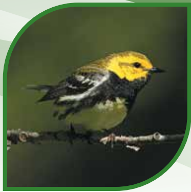
♂ Paruline à gorge noire Black-throated Green Warbler Setophaga virens