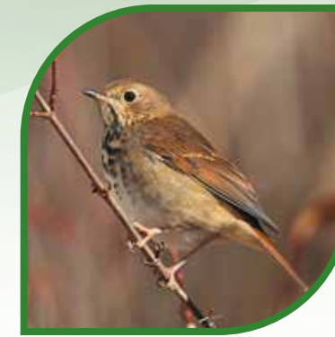
♀ Grive solitaire Hermit Thrush Catharus guttatus