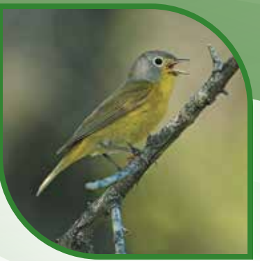
♀ Paruline à joues grises Nashville Warbler Leiothlypis ruficapilla