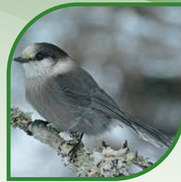
♀ Mésangeai du Canada Canada Jay Perisoreus canadensis