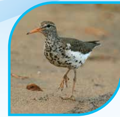
♀ Chevalier grivelé Spotted Sandpiper Actitis macularius