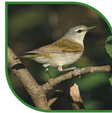
♂ Paruline obscure Tennessee Warbler Leiothlypis peregrina