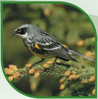
♂ Paruline à croupion jaune Yellow-rumped Warbler Setophaga coronata