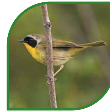
♂ Paruline masquée Common Yellowthroat Geothlypis trichas