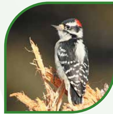
♂ Pic mineur Downy Woodpecker Dryobates pubescens