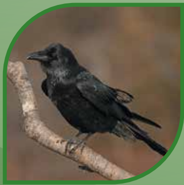
♀ Grand Corbeau Common Raven Corvus corax